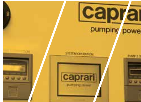
Pump Control Technology