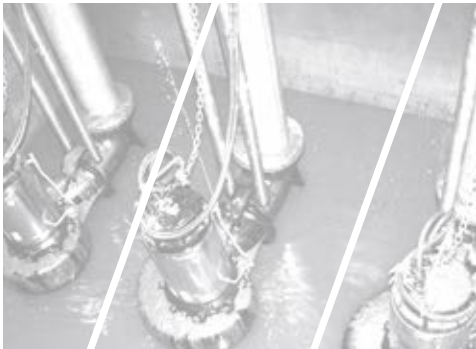
Transport & Treatment