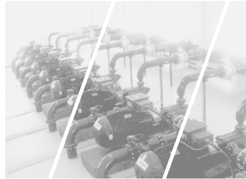
Boosting & Distribution