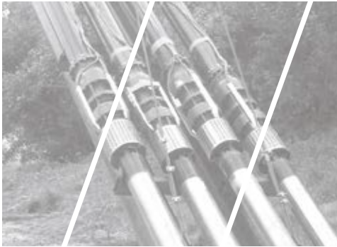
Collection & Distribution

CAPRARI SPA Modena (Italy) • CAPRARI FRANCE SARL Maurepas - Paris (France) • BOMBAS CAPRARI SA Alcalà de Henares Madrid (Spain) • CAPRARI PUMPS (U.K.) LTD Peterborough (United Kingdom) • CAPRARI PUMPEN GMBH Fürth/Bayern (Germany) • CAPRARI PORTUGAL LDA Santarém (Portugal) • CAPRARI PUMPS AUSTRALIA PTY LTD Beverley SA (Australia) • CAPRARI HELLAS SA Thessaloniki (Greece) • CAPRARI TUNISIE SA Ben Arous (Tunisia) • CAPRARI PUMPS (SHANGHAI) CO LTD Shanghai (People's Republic of China) • CAPRARI PUMPS NEW ZEALAND Christchurch (New Zealand)